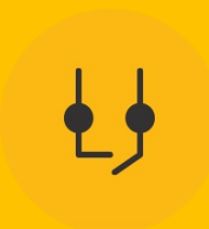
Saída contato seco