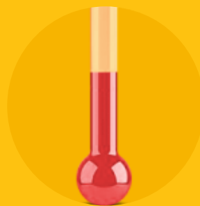
COMPENSAÇÃO DE TEMPERATURA