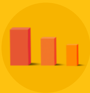
AJUSTE DE SENSIBILIDADE